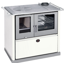
Bianco / Inox