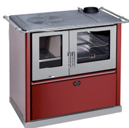
Bordeaux / Inox