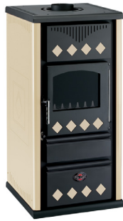
Beige / Beige