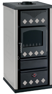
Inox / Inox