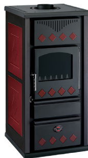
Grigio / Bordeaux