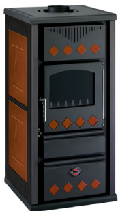
Grigio / Cuoio