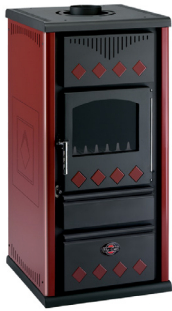
Bordeaux / Bordeaux