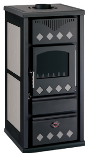
Grigio / Inox